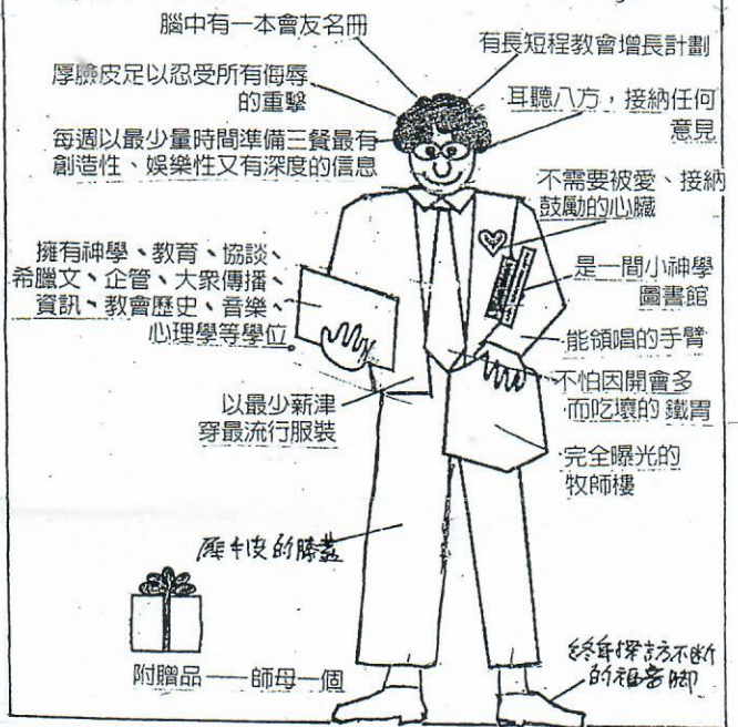
(參照及降, 牧事專奉的藝術, 使徒)